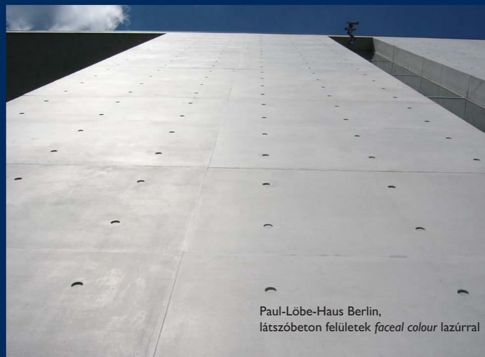
Paul-Löbe-Haus Berlin, látszóbeton felületek faceal colour lazúrral

A faceal colour egy pigmentált, oldószermentes impregnálóanyag, amely a porózus felületek kapillárisaiba felszívódva redukálja a felületi feszültséget. A kezelt felületen így a szennyeződés kevésbé tapad meg, illetve a felület könnyen tisztíthatóvá válik.